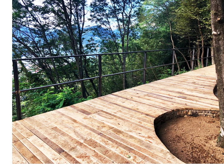
Parco / Terrazza panoramica sul lago