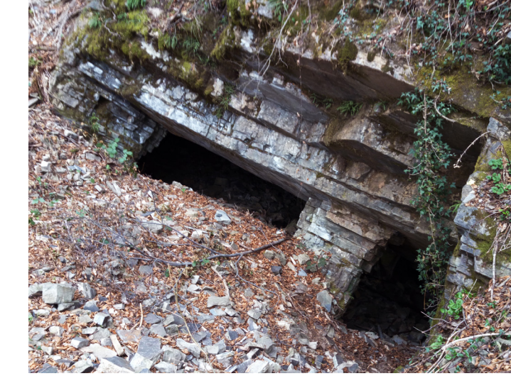
Miniera di Selvabella