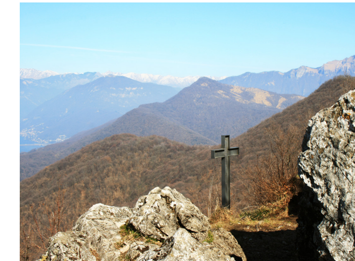
Observatorio Monte Orsa