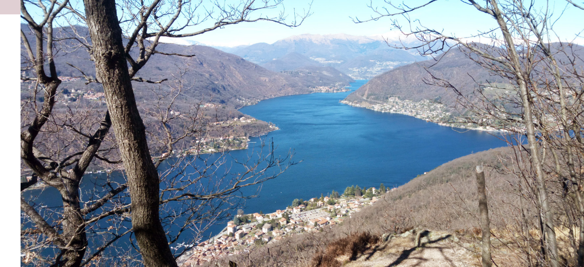
View of Monte Grumello