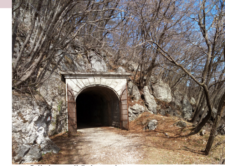
Batteria per artiglieria pesante