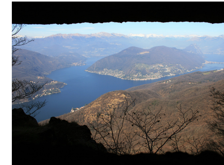
Observatorio Monte Orsa