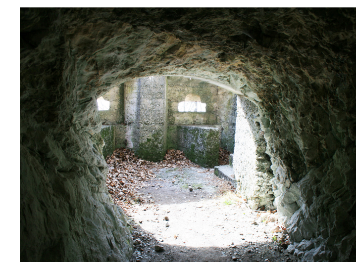
Postazione per mitragliatrici