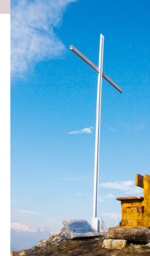
Croce di Besano