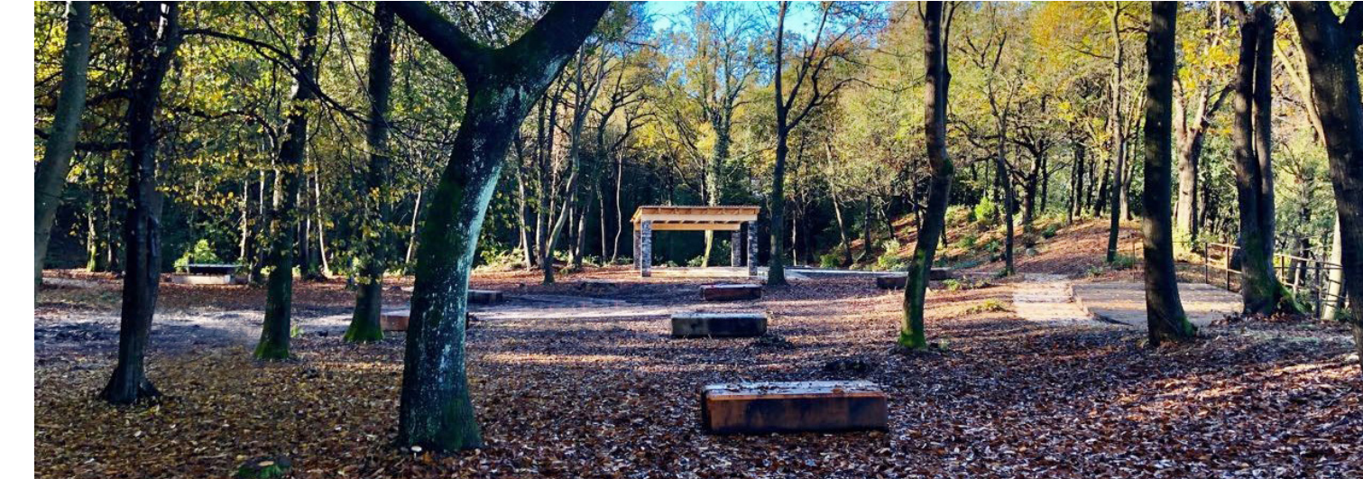
Parco Rio Ponticelli