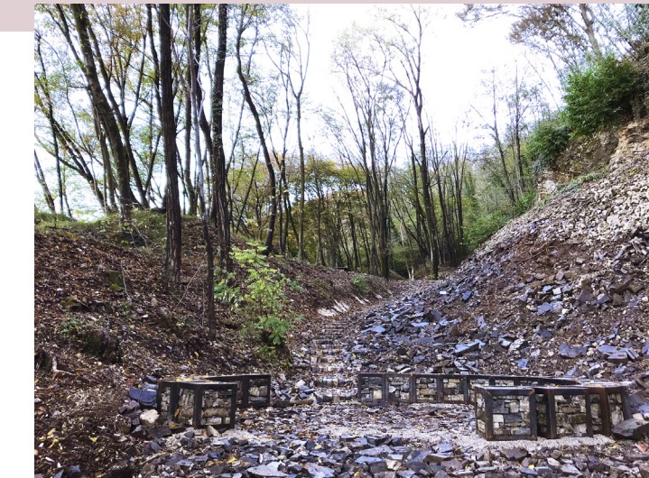
Miniera delle Piodelle / Area di sosta