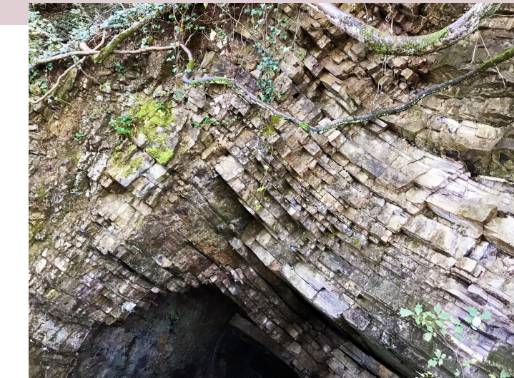
Miniera delle Piodelle