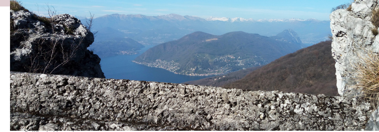
Fortificazioni in cresta