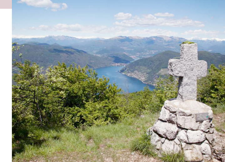
View of Monte Pravello