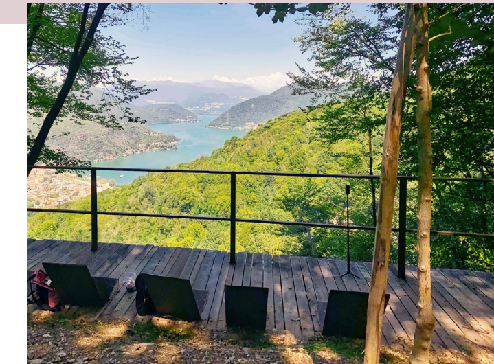
Miniera delle Piodelle / Sosta panoramica