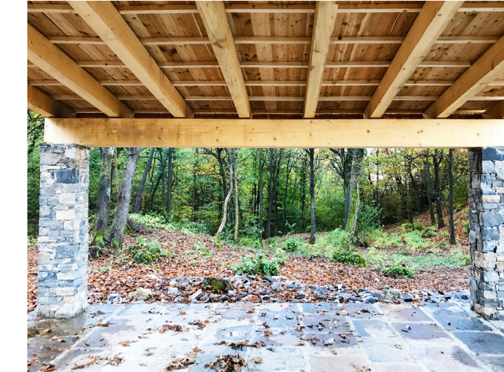
Parco / Struttura per eventi